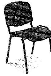
Rys. 2. Krzesło.